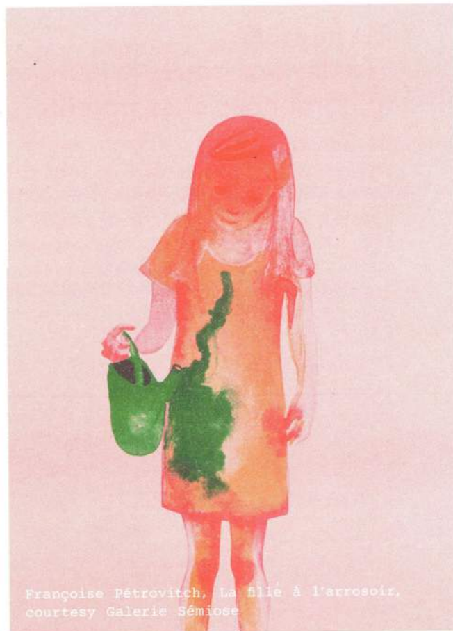
Françoise Pérovitch, La fille à l'arrosoir , courtesy Galerie Sémiose

A vif , Françoise Pérovitch, jusqu'au 16 septembre, Centre de la gravure et de l'image imprimée, La Louvière, www.centredelagravure.be